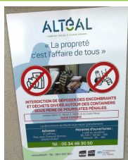
Malgré les affiches

Beaucoup de déchets sont abandonnés au pied des conteneurs. Ces points d'apport volontaires se transforment en dépotoirs qui attirent, chiens, chats et rats.