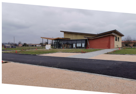
Vue de la Salle Polyvalente depuis les parkings