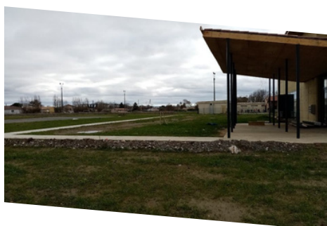
Un cheminement permet le raccordement entre l'école, les terrains de sport et la Salle Polyvalente.