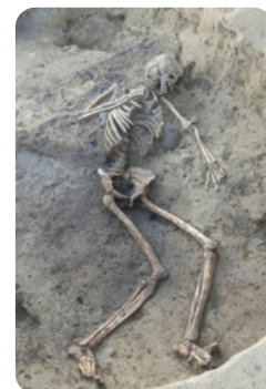
Vestiges d'un individu inhumé dans une grande fosse à l'âge du Bronze

La deuxième occupation se rattache à la période médiévale (entre le 9 ème et le 11 ème siècle de notre ère).