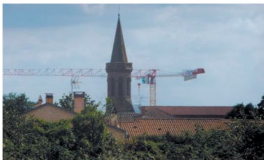
Le projet Alteal (ex Colomiers Habitat) avance bon train pour une livraison mi 2019, logements et surfaces pour les commerces

L'ÉCHO DE SAINT HILAIRE Publication de la mairie de Saint-Hilaire 31410 Tél. 05 34 46 01 90 - mairie.sthilaire31@wanadoo.fr Directeur de la publication : André Morère Conception rédaction : Monique Salamon Maquette et mise en page : Estelle Fontaine Impression : Imprimerie Cazaux à Muret. Tirage : 600 exemplaires. Remerciements aux élus, à tout le personnel de la mairie et de la Muretain Agglo, et à l'ensemble des associations pour leur soutien et leur aimable participation à la réalisation de cette publication.