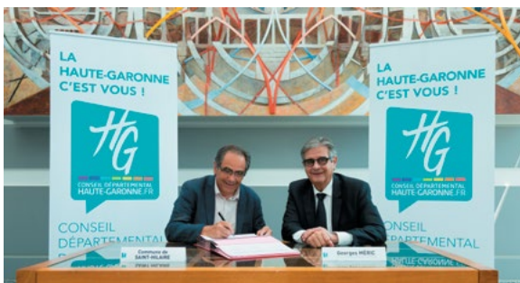
La signature du contrat de territoire avec le Président du Conseil Départemental le 12 juin 2018