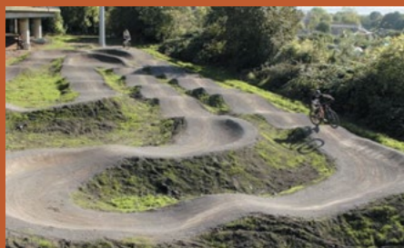
... pour une piste Pumptrack similaire à celle-ci !

La commune a profité des terrassements des lotissements pour faire effectuer cet apport de terre sur la plaine sportive afin de faire réaliser une piste de Pumptrack.