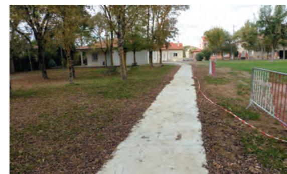
Liaison voie Tolosane

Dans le cadre de l'Ad'AP (Agenda d'Accessibilité Programmée) approuvé par arrêté préfectoral en date du 18 février 2016, les travaux d'accessibilité des IOP (Installations ouvertes au public) avec les travaux du cheminement de la plaine sportive se sont poursuivis cet été. Un autre programme pour 2019/2020 est en cours d'élaboration. ■