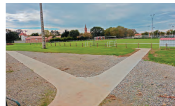
Liaison impasse de l'Oraison