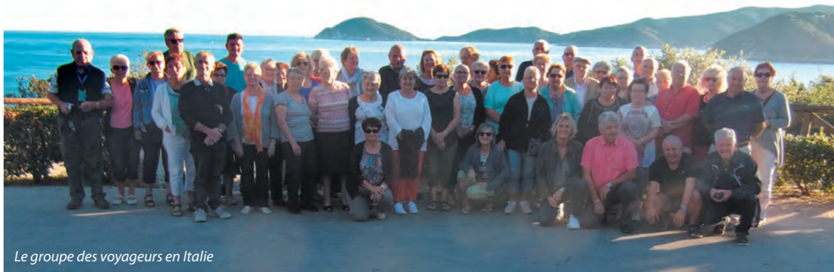
Le groupe des voyageurs en Italie