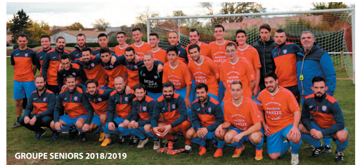
GRUPE SENIORS 2018/2019