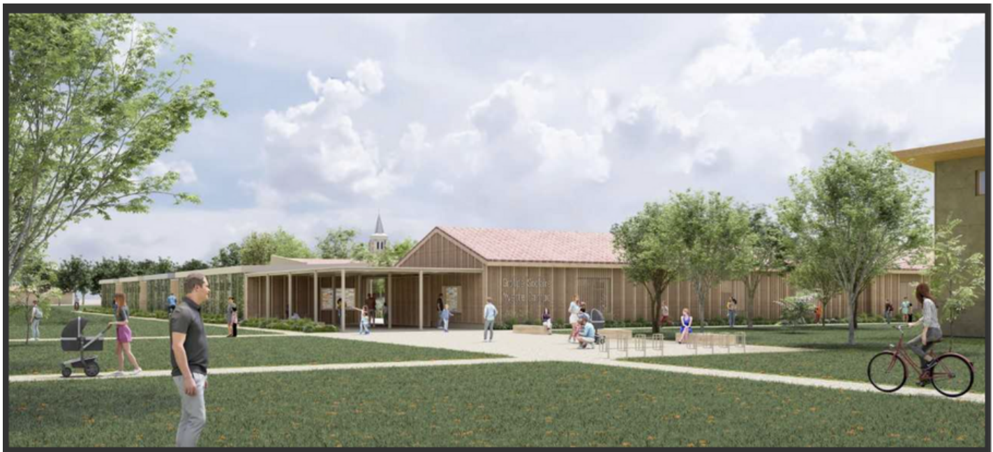
Insertion paysagère – vue de la nouvelle entrée au groupe scolaire

L'entrée principale de l'école sera déplacée sur la façade Nord de l'école. Le parking de la salle polyvalente déjà existant deviendra également le parking de l'école. Les déplacements des enfants et leurs familles pourront se faire en toute sécurité.